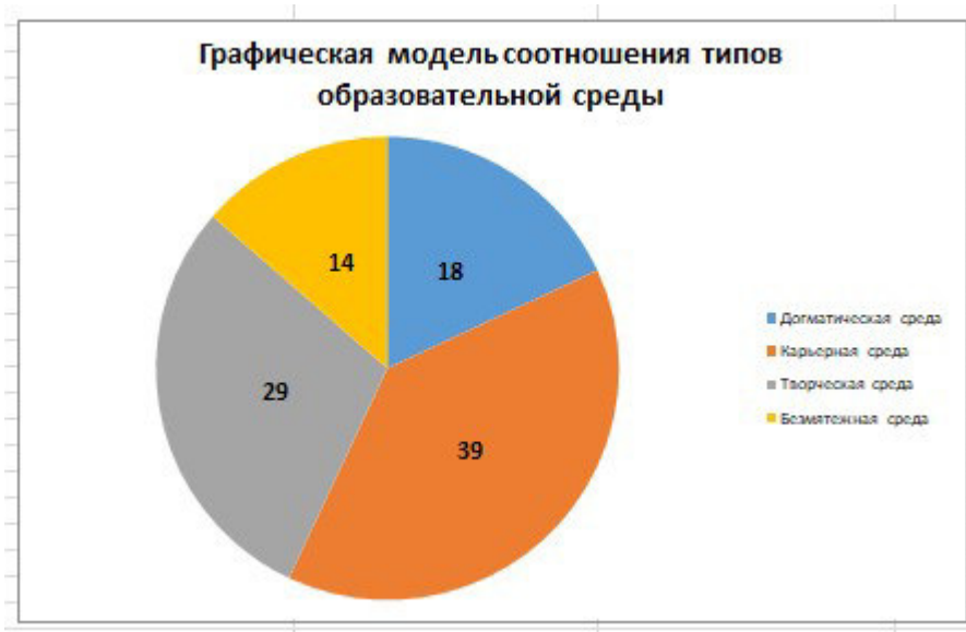
Рис.1. Графическая модель соотношения типов образовательной среды в ОО

Анализ имеющихся данных свидетельствует о сочетании двух